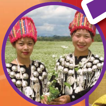
ミャンマー・Kachin族 そば畑にて

身近な食材のそば。 実は国際協力の立役者であるをご存知ですか? 海外で栽培されるそばが、麻薬撲滅に大いに貢献しているのです。 安全で安心な社会の実現のために、 ぜひ知ってほしいこと。一緒に考えてほしいこと。 そばを楽しむことから、新たな世界が広がるかもしれません。