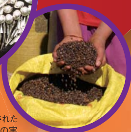
ミャンマーで収穫された そばの実