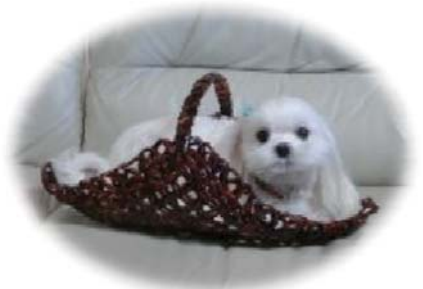
受講生作品 アンデルセン手芸(籠)