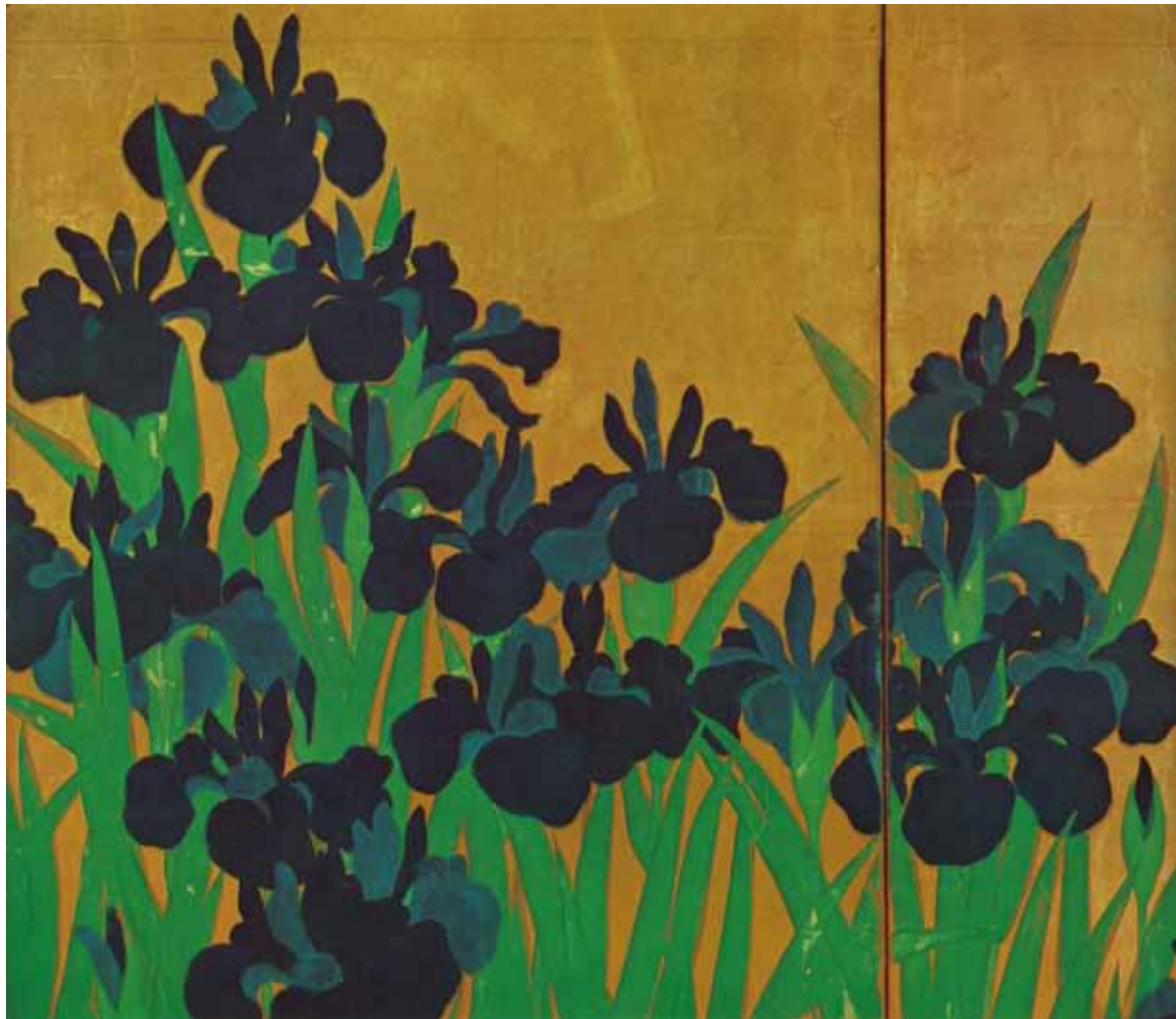
国宝 燕子花図 左隻 部分図 根津美術館所蔵