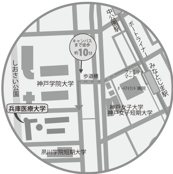
兵庫医療大学アクセス