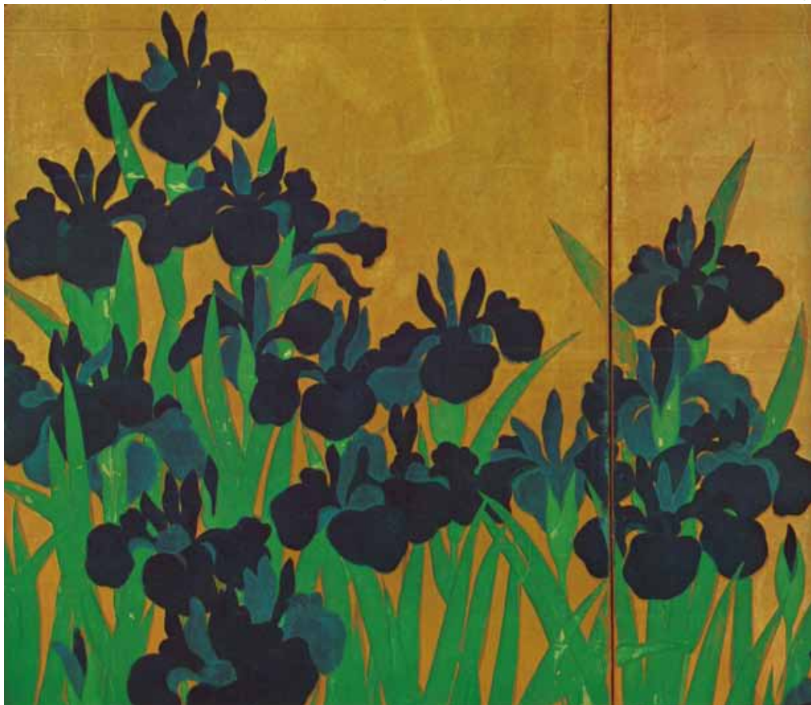
国宝 燕子花図 左隻 部分図 根津美術館所蔵