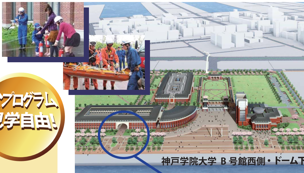
神戸学院大学 B号館西側・ドーム下