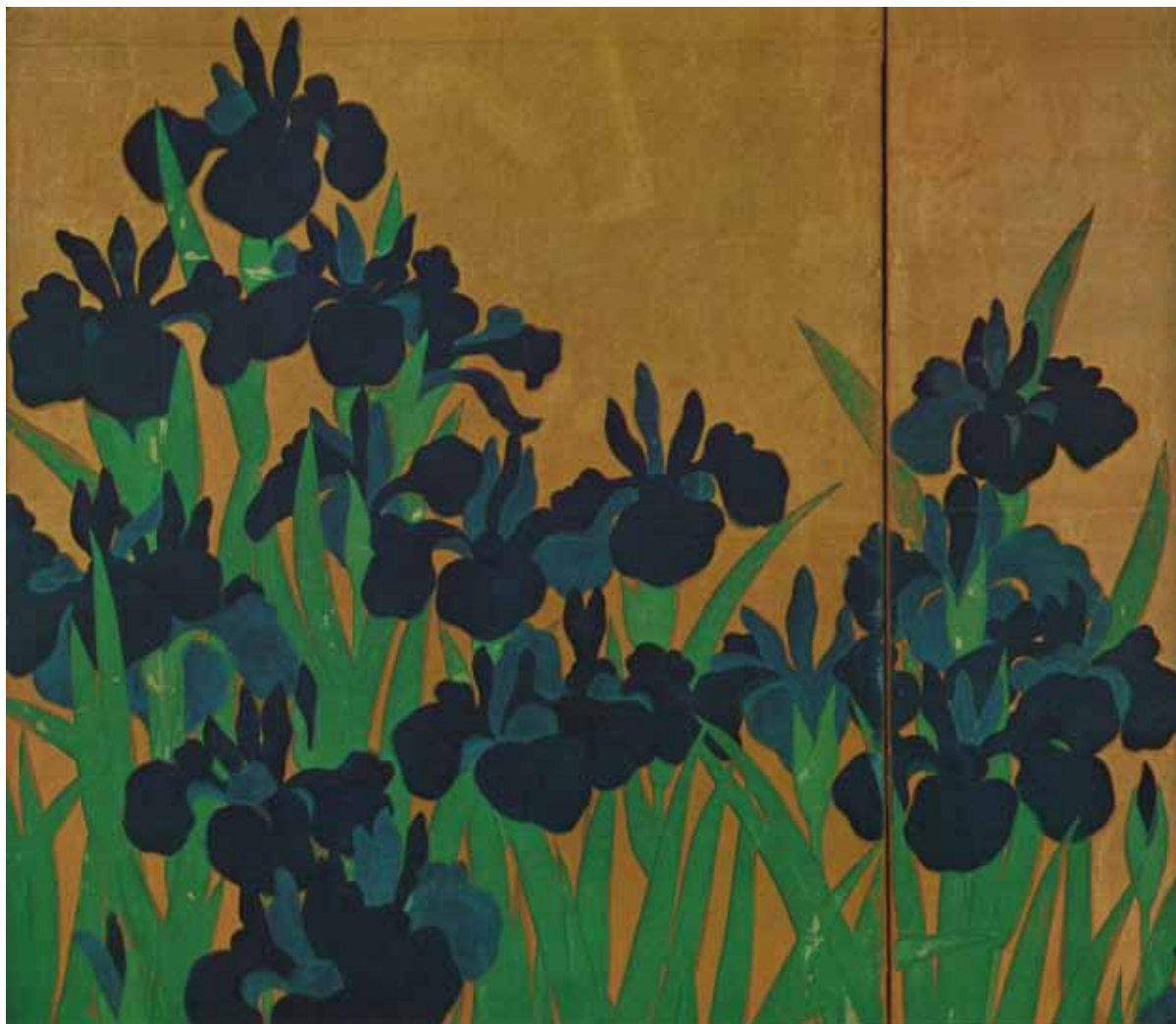
国宝 燕子花園 左隻(部分)尾形光琳筆 根津美術館所蔵

シニアライフの魅力を見つけたい方、さらに健康になりたい方に・・・ 担当大学： 兵庫医療大学