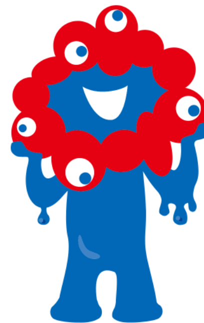
大阪・関西万博 公式キャラクター ミヤクミヤク