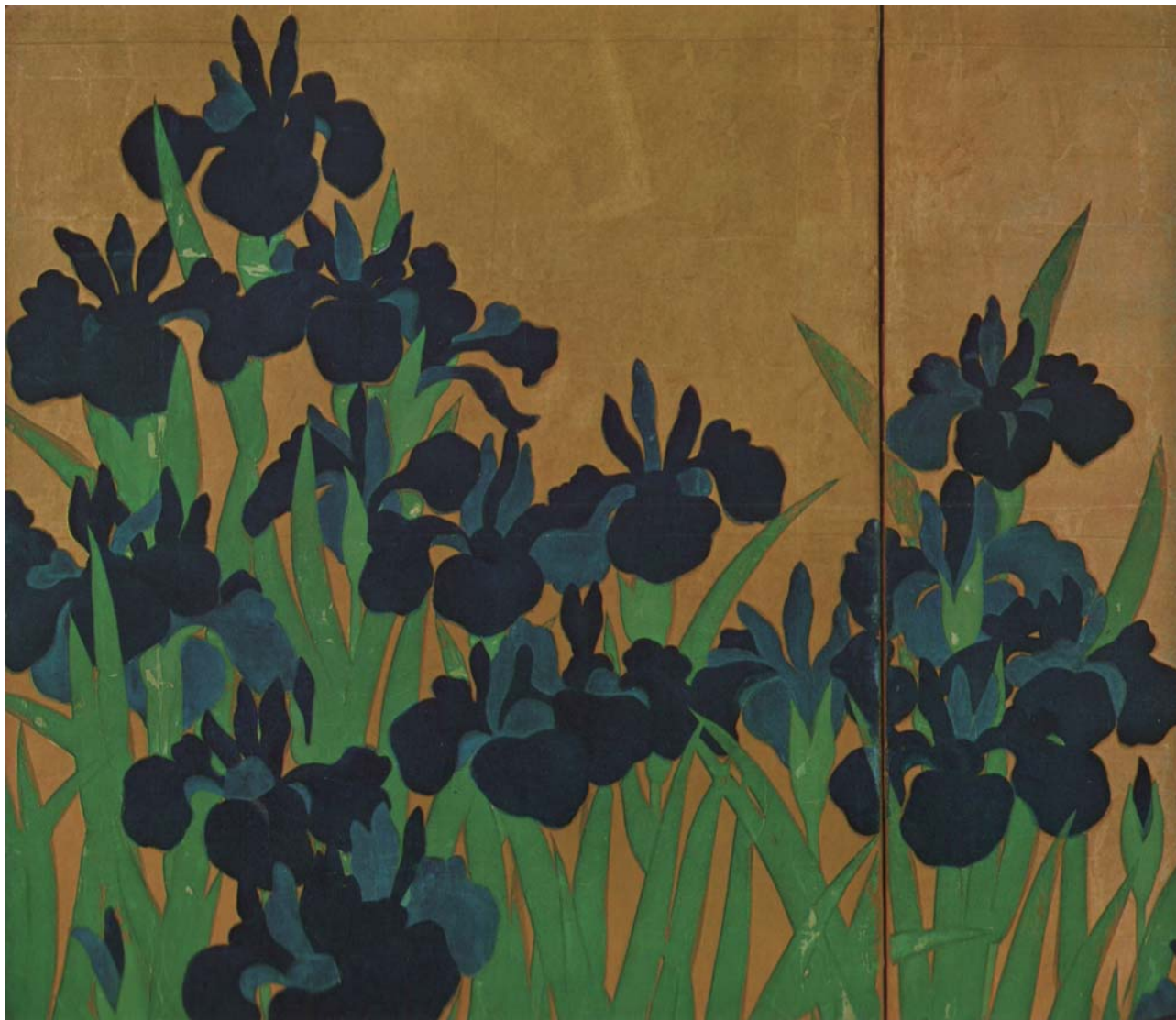
国宝 燕子花図 左隻 部分図 根津美術館所蔵