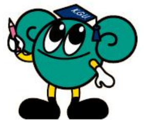
神戸学院大学のマスコット マナビー